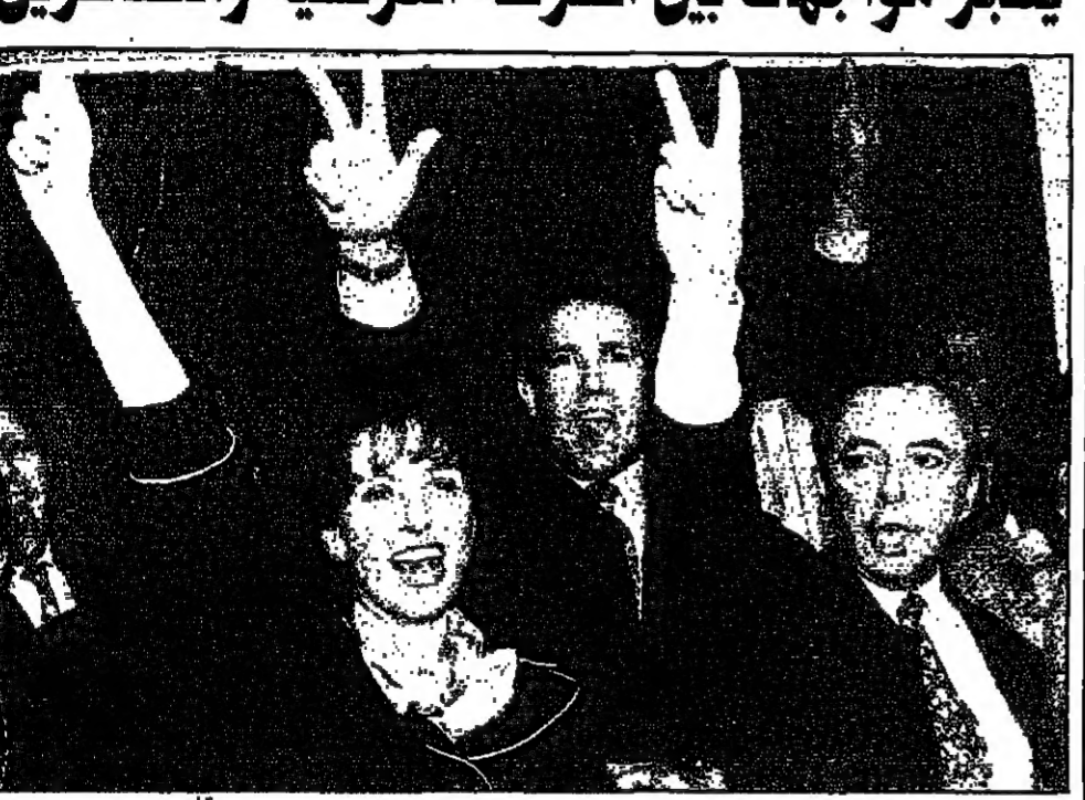
كاترين ميري، وهي ابنة زوجها بيرون ميري الزعيم الثاني لحزب الجبهة الوطنية، ترفع بيما لافتة للترشح قبل فورا برئاسة بلدية فيرول (روني)

باريس - فيرول: الف بة اعربت الصحف الفرنسية الصادرة امس الاثنين عن القلق ازاء فوز مرشحة الجبهة الوطنية اليمينية المتطرفة كاترين ميري امس الاول على مرشح الحزب الاشتراكي جان جاك انغلاد في الانتخابات البلدية التي جرت في مدينة فيرول بجنوب فرنسا امس الاول. وقد حلفت ميري، زوجة الرجل الثاني في الجبهة الوطنية برون ميري، انتصارا كبيرا في هذه الانتخابات لتصبح ليرول بذلك المدينة الرابعة التي يسيطر عليها حزب جان ماري لوين بعد تولون واورنج وماريتاين. وفي تحصيله اتخذ شكل خصبة الى الغالبية الحاكمة تحت قيادة ميري، وقال ميري ان هذا الفوز هو انتصار للجبهة الوطنية، وتحديدا لانها ستتمكن من اعادة ترقية بلدية فيرول، وقد تقدمت بطلب لفتح مركزين في مرشحين من الغالبية يتمتعون بصلاحيات استثنائية. وتعد صحيفة «ليبيراسيون» انه «عدما يوافق هناك تهديد بان يسيطر اليمين المتطرف على احدى البلديات، يعود اليمين الى ارجع، ومع زوها من ترشيح نفسه هذه المرة بعد ان ادانته محكمة بارتكاب مخالفات في اطلاق النار على حمله الانتخابية عام 1995، وقال لوين ان الفرنسيين سيمركون عيوب هؤلاء الذين يقربونه، ويشبههم في حل المشكلات المتكسفة مثل البطالة والهجرة والخراب. وكانت صحيفة «تشيير بلك» التي تملكها ماريون المينر المعتدل والين عرفت عيشة اثاره التي انسحب في السورة الثانية من الانتخابات من نون ان يعطي تصريحات واضحة لرونييه بالصوتيات لصالح المرشح اليساري لقطع الطريق على مرشحة الجبهة الوطنية. واقترعت صحيفة «لومانيشييه» الناطقة باسم الحزب الشيوعي الفرنسي انتصار الجبهة الوطنية تصيريا عن غياب اهتمام السلطة بالمشاكل الاجتماعية التي تواجهها فرنسا حاليا.